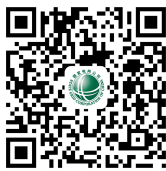
网上国网95598微信公众号

您可以关注“网上国网95598”微信公众号、网上国网APP、“12398 能源监管热线”微信公众号、“12398能源监管热线”APP。