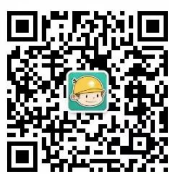
浙江电力公众微信

您可以关注公众微信“国网浙江电力”(sgcc-zj)、网上国网APP、公众微信“12398能源监管热线”、“12398能源监管热线”APP。